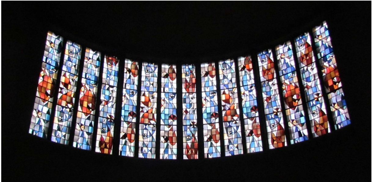
Fenster im Altarraum in Richtung Osten

Die Fenster der Marienkirche sind echte Kunstwerke. Der Künstler ist leider nicht bekannt.