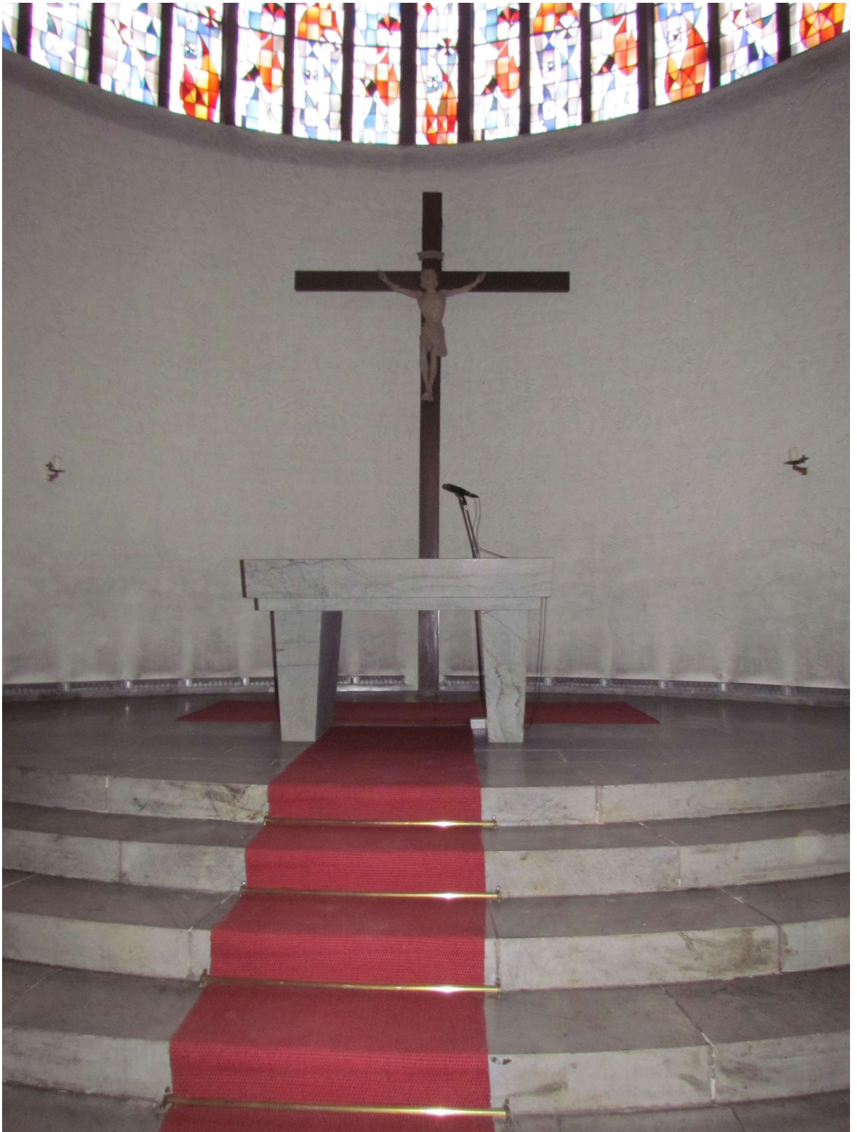
Der Altarraum mit dem großen Altarkreuz