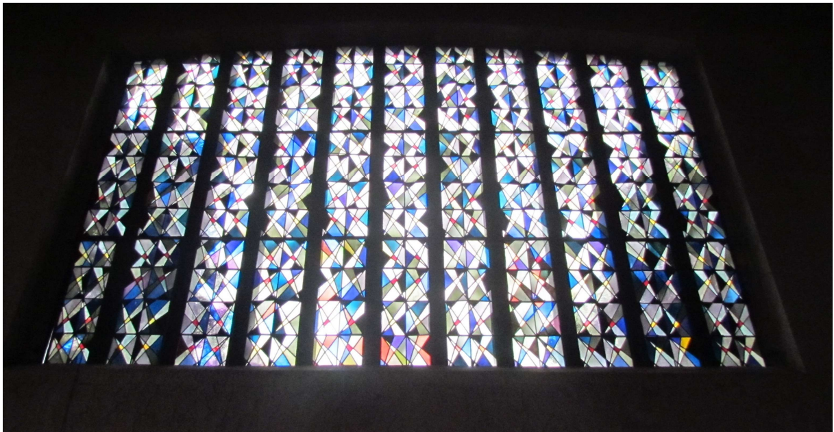
Fenster über dem Eingangsportal in Richtung Westen